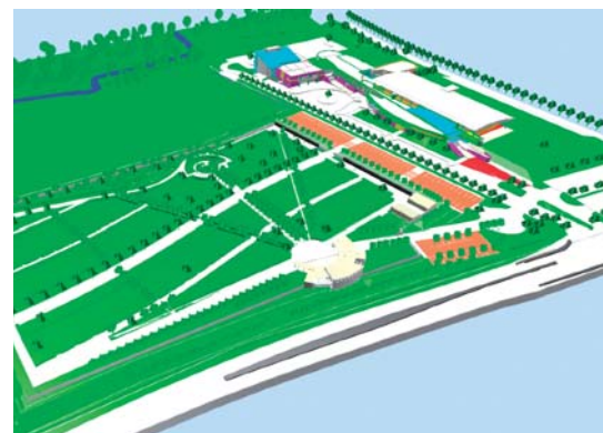
Plan de construction Sodex Architecture et urbanisme

L'ouverture du cimetière intercommunal est prévue à l'automne 2011.