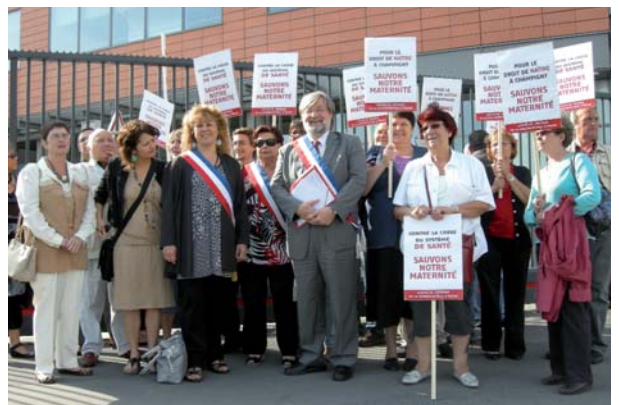
Devant le siège de l'Agence Régionale de la Santé d'Ile-de-France, le 15 juin 2011