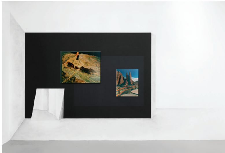
Vue de l'exposition Atlante de Constance Nouvel, Galerie In Situ - fabienne leclerc, Paris © Constance Nouvel / Aurélien Mole

Atlante a été présenté à la Galerie In Situ - fabienne leclerc du 16 février au 30 mars 2019