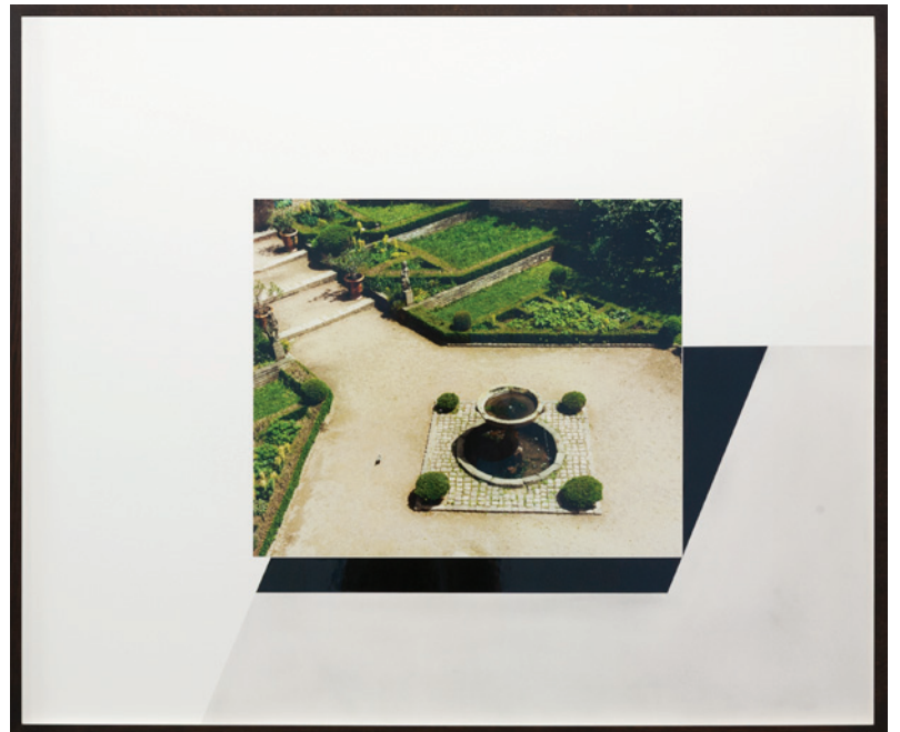
Constance Nouvel, Plan-image IX , 2019