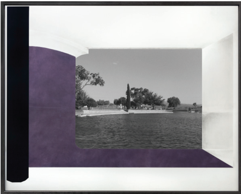
Constance Nouvel, Plan-image VIII , 2019