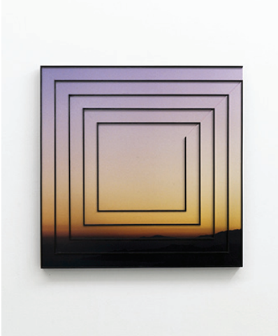
La dernière levée , 2014 © Constance Nouvel, courtesy galerie In Situ - fabienne leclerc

Née en 1985, Constance Nouvel vit à Paris et travaille à Aubervilliers. Elle développe depuis 2010 un ensemble d'œuvres qui prend pour point de départ l'analyse critique des caractéristiques de la photographie : comprendre pourquoi et en quoi le processus photographique n'est pas uniquement la reproduction d'un réel, mais aussi l'image d'une réalité tangible, ouvrant aux complexités de la représentation. Ses réflexions se déploient dans un langage plastique et formel ouvert à l'interdisciplinarité des médiums, et aboutissent à la notion d'objets photographiques. Les questions de format, d'échelle et de support sont au cœur de son travail et dialoguent dans un glissement permanent entre espace réel et espace suggéré.