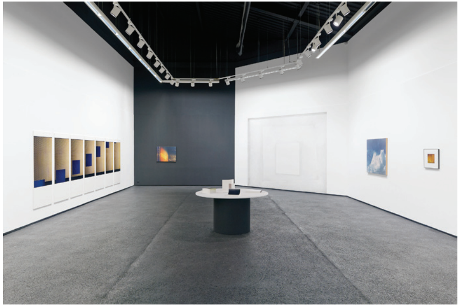
Vue de l'exposition Solstice de Constance Nouvel, Point du Jour, Cherbourg

Solstice a été présenté au Centre d'art/éditeur Le Point du Jour du 16 juin au 15 septembre 2019