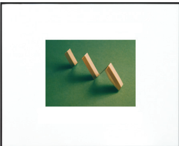
Constance Nouvel, Tétrras , 2019