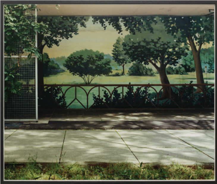
Constance Nouvel, Décors XXIII , 2019 © Constance Nouvel, courtesy galerie In Situ - fabienne leclerc