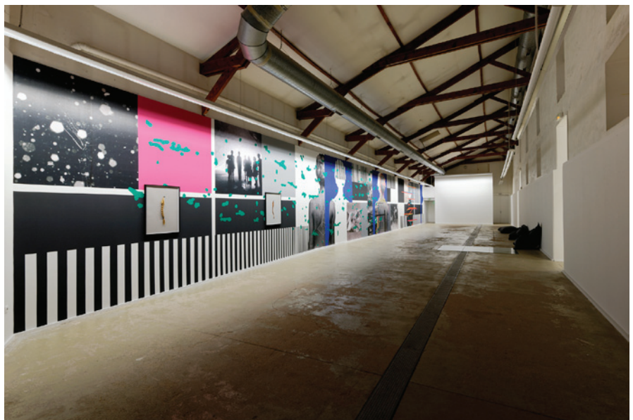
Vue de l'exposition de Barbara Breitenfellner, présentée du 2 mai au 13 juillet 2019.

Le CPIF est situé dans la graineterie d'une ancienne ferme briarde. Son architecture et sa vaste surface d'exposition de 380 m 2 en font un lieu unique en France.