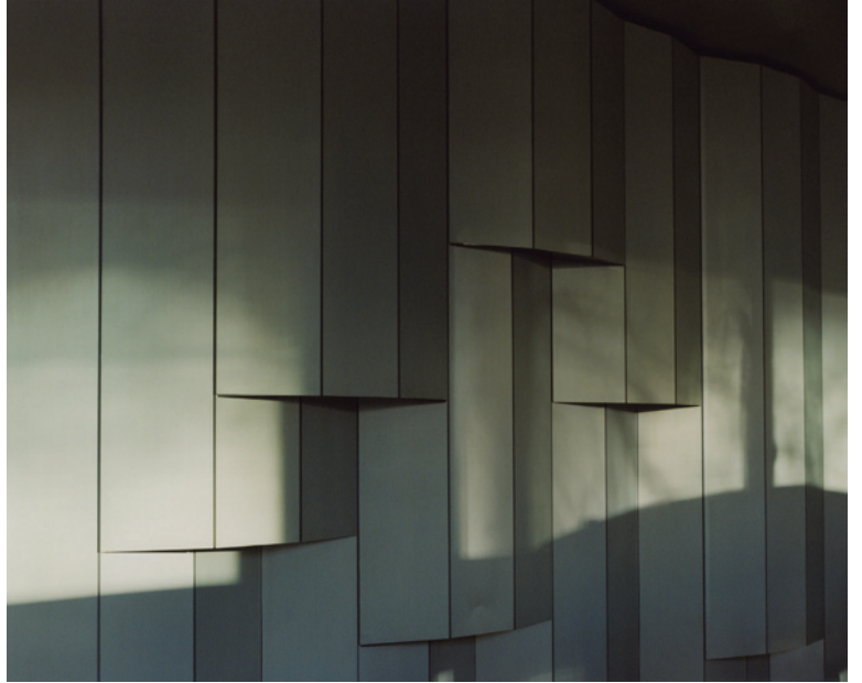
Constance Nouvel, Hologramme , 2019

Les œuvres dont les visuels sont proposés ne constituent pas une liste exhaustive