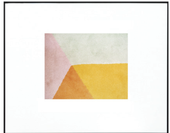
Constance Nouvel, Tangram , 2019 © Constance Nouvel, courtesy galerie In Situ - fabienne leclerc