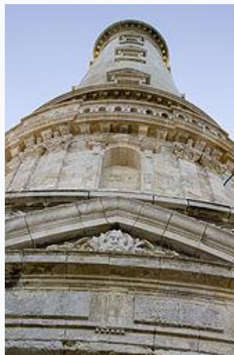
Vue du phare depuis l'entrée de l'édifice.