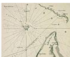
Carte de situation du plateau de Cordouan au XVII e siècle, à l'embouchure de l' estuaire de la Gironde .

Une fois le phare achevé, les défenses n'étant plus entretenues, la mer a rapidement raison de ce qui subsistait de la cité ouvrière, ne s'arrêtant qu'au roc de l'îlot de Cordouan.