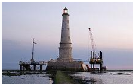
Les travaux de renforcement du bouclier entrepris en 2005.

En 2002, le phare de Cordouan est inscrit sur la liste indicative des monuments susceptibles d'être classés au patrimoine mondial de l' UNESCO .