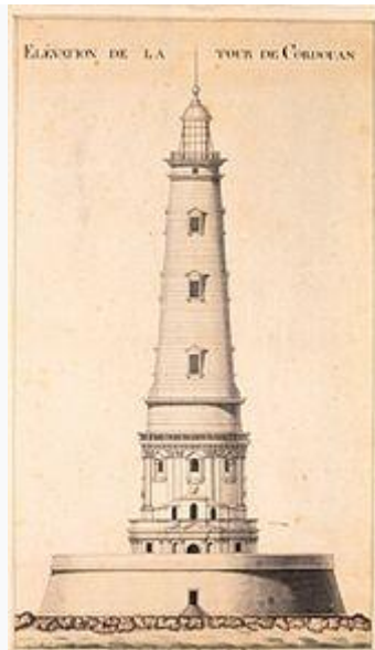
Représentation du phare au XVIII e siècle.

En 1719, la partie supérieure de la tour est démolie. Elle est reconstruite en 1724 sur de nouveaux plans, dus au chevalier de Bitry , ingénieur en chef des fortifications de Bordeaux .