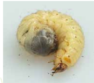
Larves de cétoine