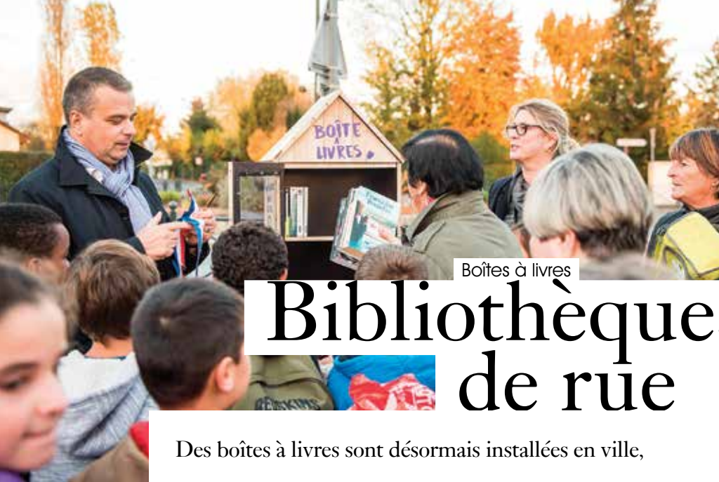
Boîtes à livres