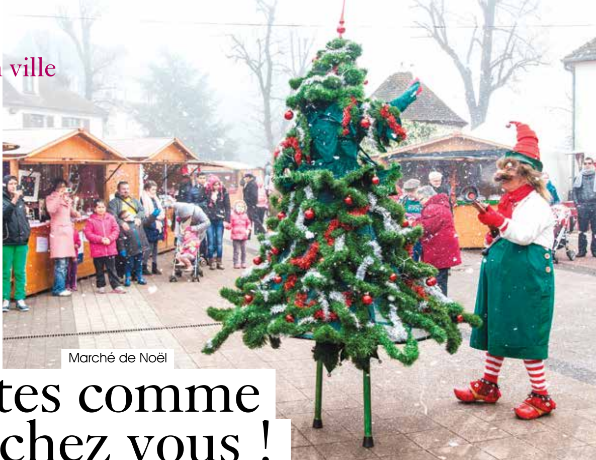
Marché de Noël